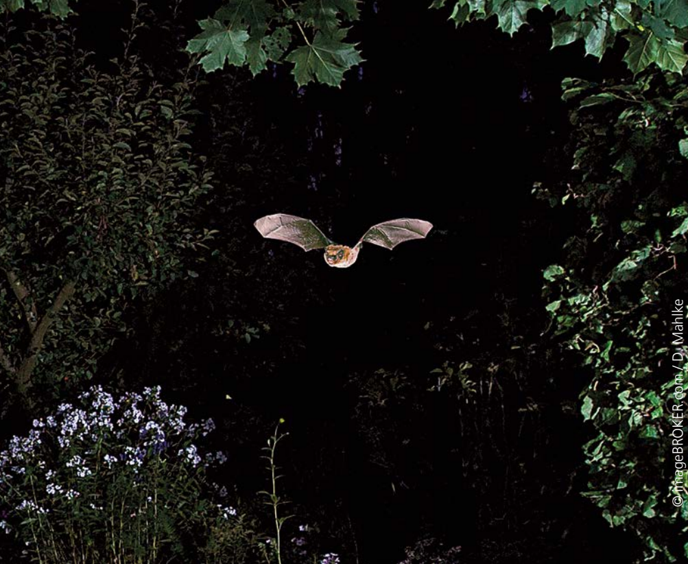
Zwergfledermaus jagt Insekten im Garten.